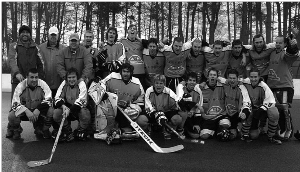
SK Suchdol nad Lužnicí