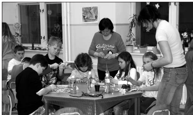
Výtvarná dílna – výroba hmyzáků z papírových krabiček