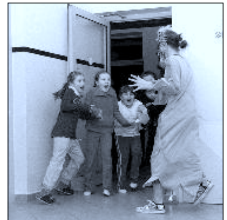
I takto vypadá strach