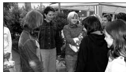
Ohlédnutí za oslavou 100. výročí založení školy v Alt-Nagelbergu (z vystoupení suchdolských žáků)