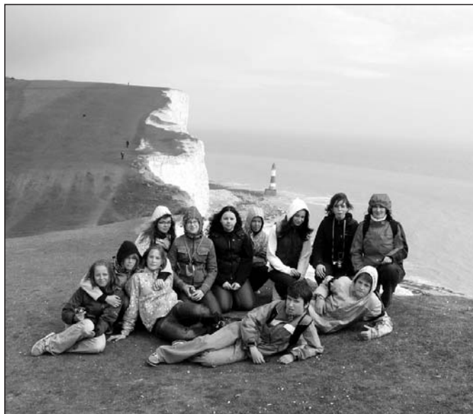
Útesy – Seven Sisters