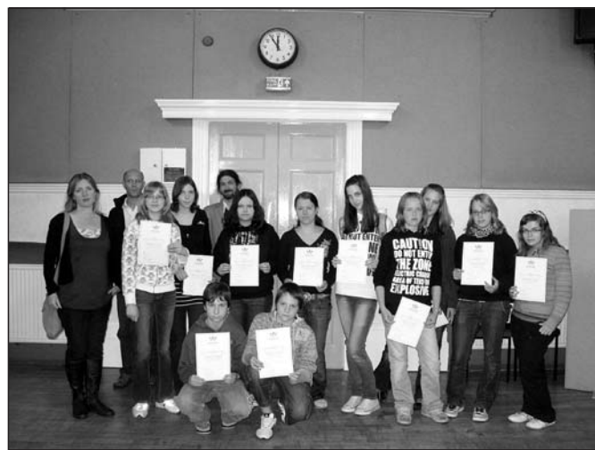
Hastings – škola, Předávání certifikátů