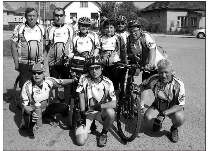
Část členů cykloklubu