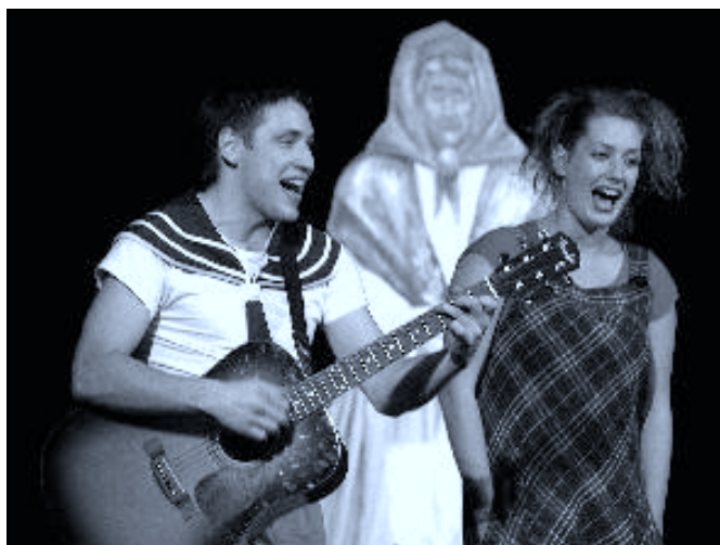
Pohádky do kapsy