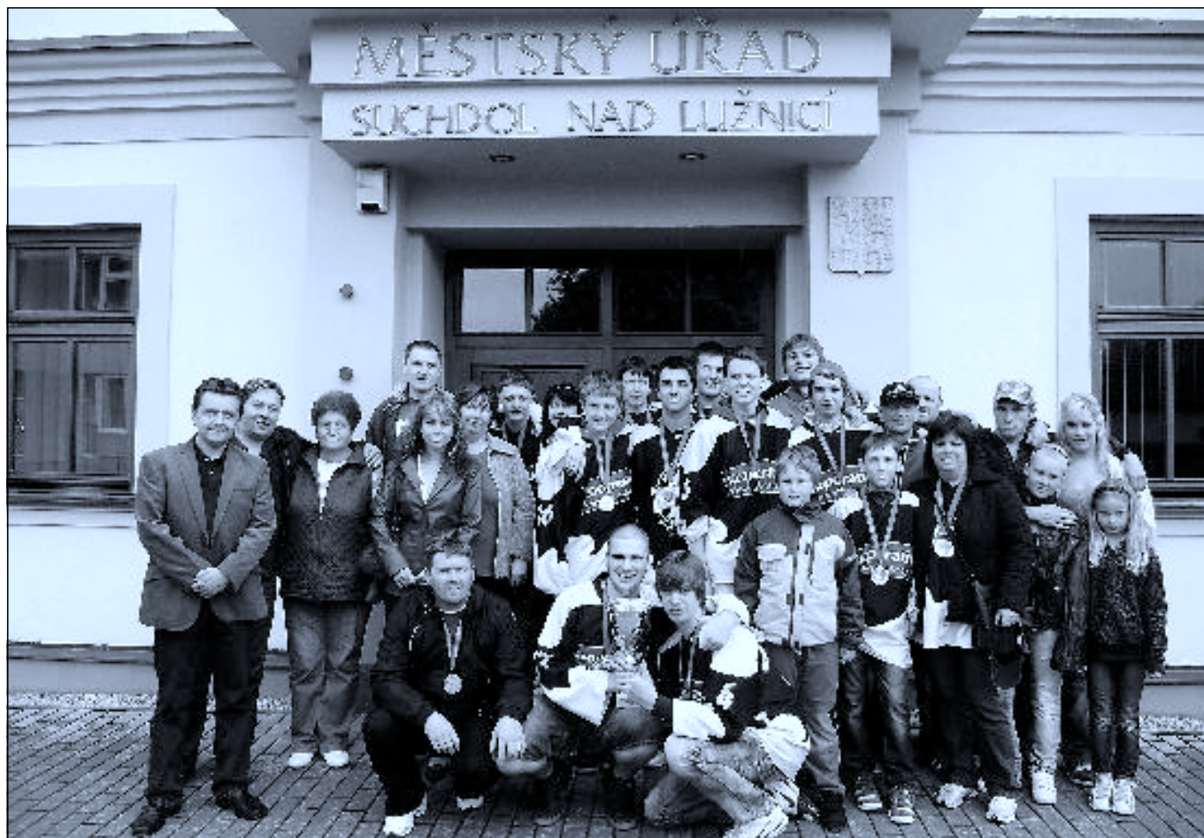
Slavnostní foto před radnicí s našimi věrnými fanoušky a panem starostou