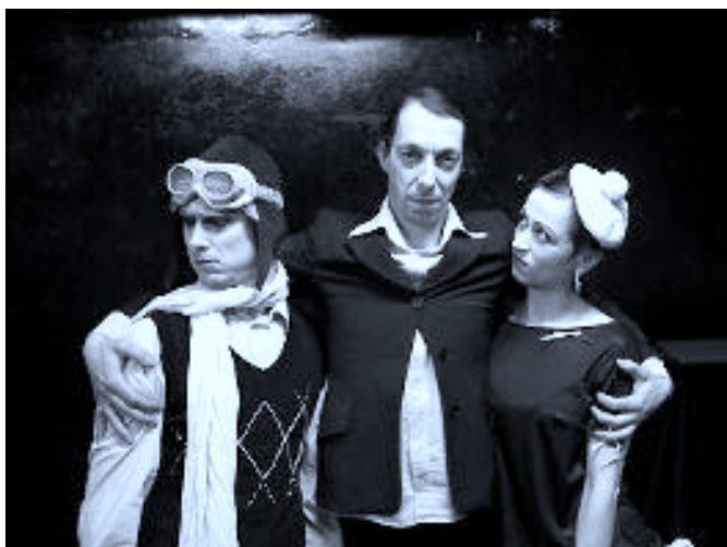
Lakomec – geisslers

Přijímáme pozvání do divadla a nejen na komedie kvůli špatné náladě, ale protože je to báječná příležitost odejít od blikajících obrazovek a spolu s přáteli se vydat na výlet do poetického a živého světa, kde lidé o cosi usilují, kde se snaží hledat souvislosti a kde se snaží změnit svět kolem sebe. Tradiční letní suchdolský festival je neodolatelná nabídka nevšedních prožitků pro každého bez ohledu na velikost vlastních starostí. Těším se opět na setkání s Vámi v našem letním divadle.