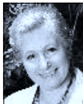
Zuzana Roithová, poslankyně Evropského parlamentu, patronka a sponzor festivalu

Přeji v pořadí již čtvrtému ročníku Suchdolských divadelních večerů mnoho zdaru, všem účinkujícím souborům příjemný pobyt v našem městě, úspěšná představení a mnoho spokojených diváků.